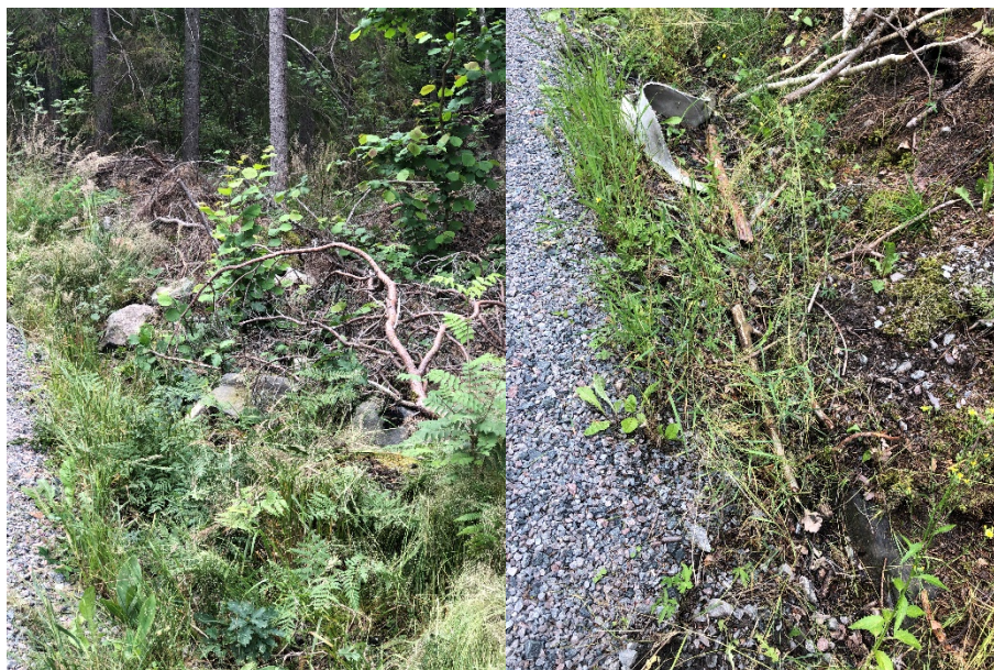
Bild 2. Ris som ligger inom vägområdet som t.ex. följer med och täpper till våra dränerande trummor som snarast behöver tas bort.