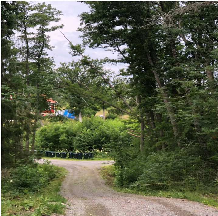
Bild 1. Träd som lutar ut över vägen och kan vara en fara för biltrafiken, arbetsmiljömässigt och framkomligheten.

Styrelsen har även under räkenskapsåret inspekterat vägområdet för att se om vi uppfyller de krav TRV har för att bidrag skall utgå. Vid inspektionen har vi sett att träd, stubbar och ris finns inom vägområdet och behöver tas ner och bort av respektive mark-/fastighetsägare och det snarast!